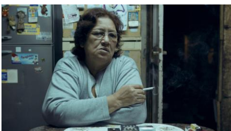
EN LA BOCA | Regie: Matteo Gariglio | 25 Min. | Schweiz, Argentinien, 2016

Jeden Tag werden die Männer zu einer winzigen Bar gezogen, wo sie ihre Zeit verbringen, um zu trinken, zu plaudern und auf die Rennen auf dem nahe gelegenen Radweg zu wetten. Diese Orte aus fast nichts erzählen Geschichten über fast alle.