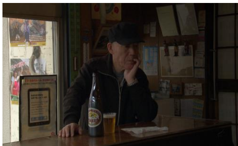
KAWASAKI KEIRIN | Regie: Sayaka Mizuno | 40 Min. | Schweiz, 2016

Im Wettbewerb des 1.ten internationalen Debütfilmfestival „Rudnik“ – 2 Schweizer Teilnehmer: