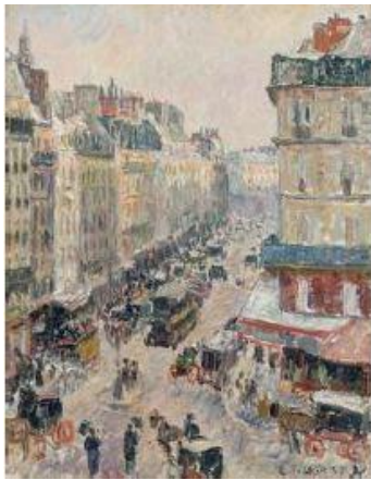
CAMILLE PISSARRO Rue Saint-Lazare, Paris, 1897 Huile sur toile, 35 x 27 cm