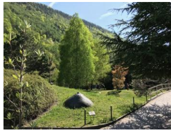
Le parc de sculptures