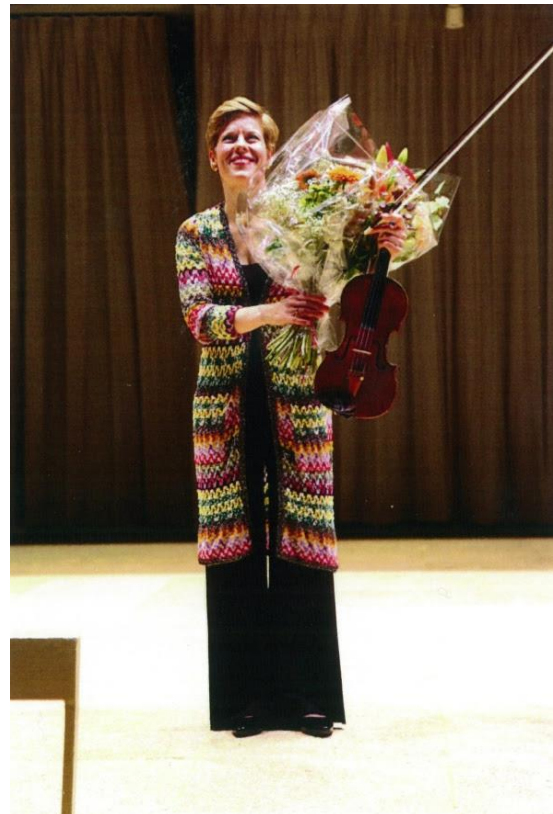
Isabelle Faust à la Fondation Pierre Gianadda en 2017