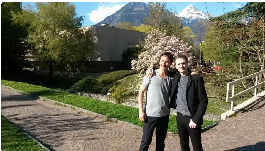
Jean Guihen Queyras et Alexandre Tharaud dans les jardins de la Fondation en avril 2018

JEAN-GUIHEN QUEYRAS, violoncelle ALEXANDRE THARAUD, piano