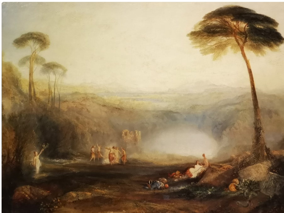
Le Rameau d'Or Exposée en 1834 huile sur toile 61.6 x 92.4 cm cm Don de Robert Vernon, 1847