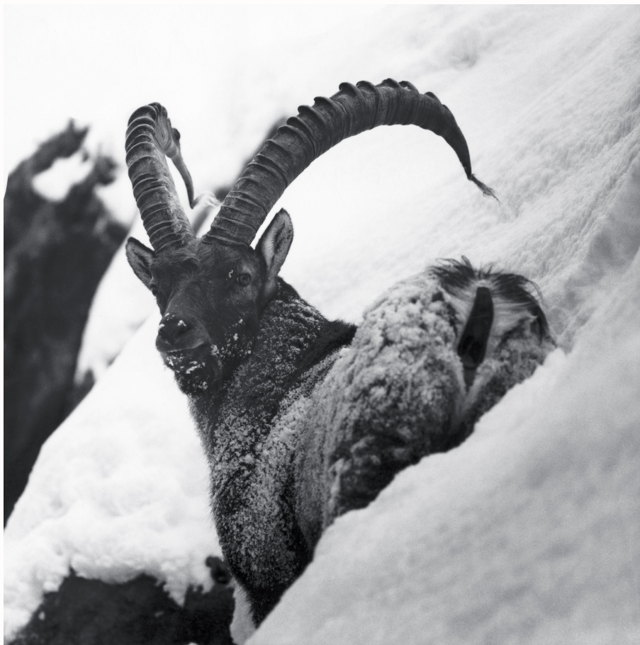
IBouquetin, janvier 1970