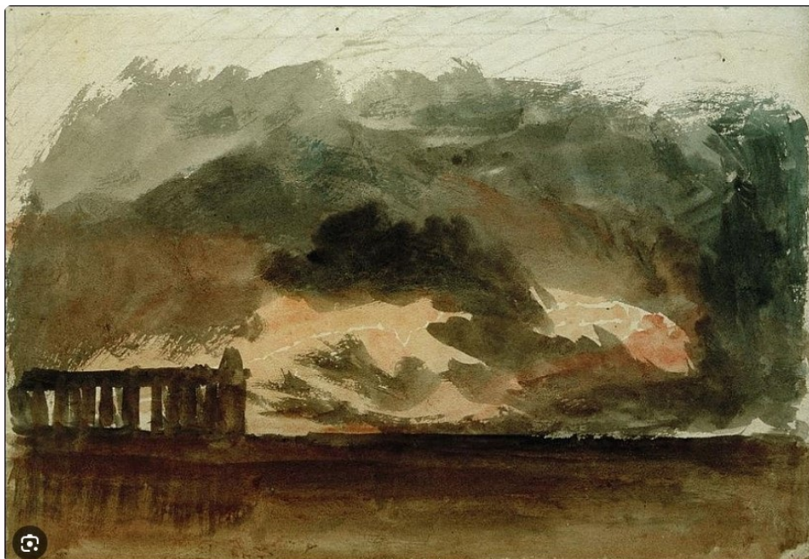
Paestum Vers 1823/1826 Mine de plomb et aquarelle sur papier 21.4 x 30.8 cm Acceptée par la nation comme part du Legs Turner en 1856

Cette aquarelle fait partie de la section : Mise en situation. Le sujet montre l'intérêt de Turner pour l'Antiquité, il reçoit une solide éducation à l'Académie royale. Colonie grecque fondée en 600 av. Jésus-Christ, au sud de Salerne. Appelée Poséidonia, elle est baptisée Paestum quand elle devient romaine. Il s'agit du site le plus au sud de l'Italie visité par Turner en 1819/1820. Il montre un des temples doriques qui résiste fermement à la tempête. Dans la zone libérée par les nuages, il décrit d'un trait la foudre qui peut-être, symboliquement pour Turner évoque la fin d'une religion morte. Les nuages lourds envahissent Paestum, ils sont brossés à coups de pinceaux dynamiques et l'artiste leur donne un air menaçant. Turner aime peindre une nature dramatisée et la puissance des éléments déchaînés.