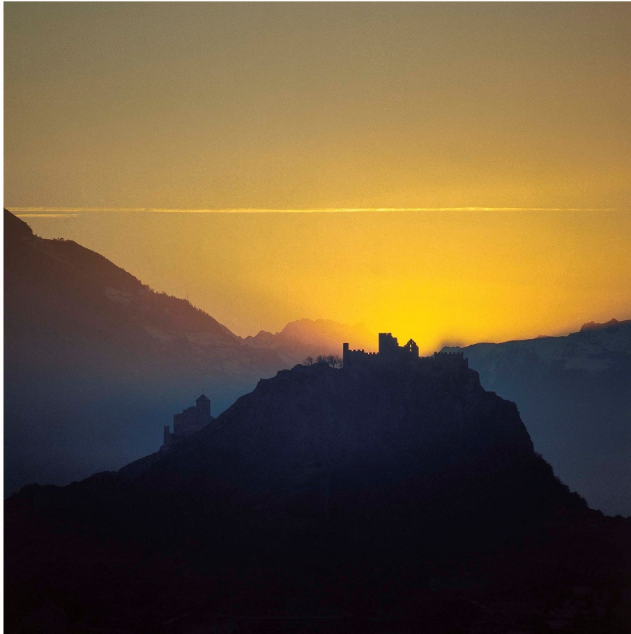
Sion 29 novembre 1979