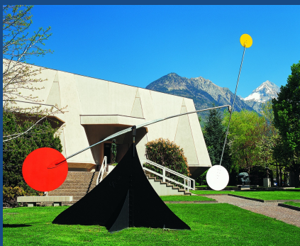
Alexandre calder Stabile-Mobile Brasilia, 1965

Venez déguster notre tarte à l'abricot maison