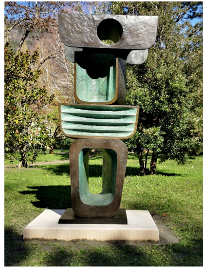
©Barbara Hepworth-Ancestor I