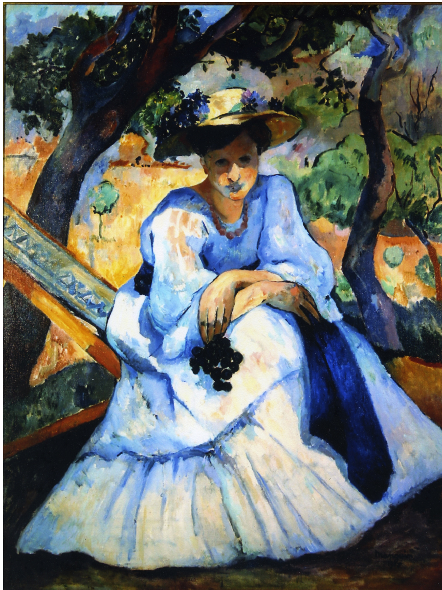
Henri Manguin, La Femme à la Grappe-villa Demièrre - 1905 - huile sur toile 116 x 81 cm - Fondation Pierre Gianadda, Martigny