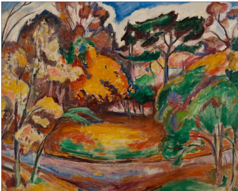
© Emile Othon Friez - Automne à Honfleur, 1906 huile sur toile 64 x 80 cm - AMVP 2579 Donation de Henry-Thomas en 1984 Paris Musées / Musée d'Art moderne de Paris