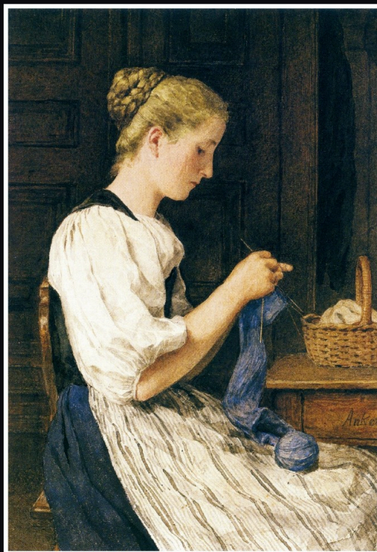
Fille tricotant dans un intérieur. Non daté. Aquarelle sur papier, 35 x 24,8 cm. Fondation Pierre Gianadda