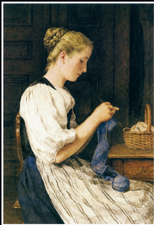
Fille tricotant dans un intérieur, Non daté, Aquarelle sur papier, 35 x 24,8 cm, Fondation Pierre Gianadda