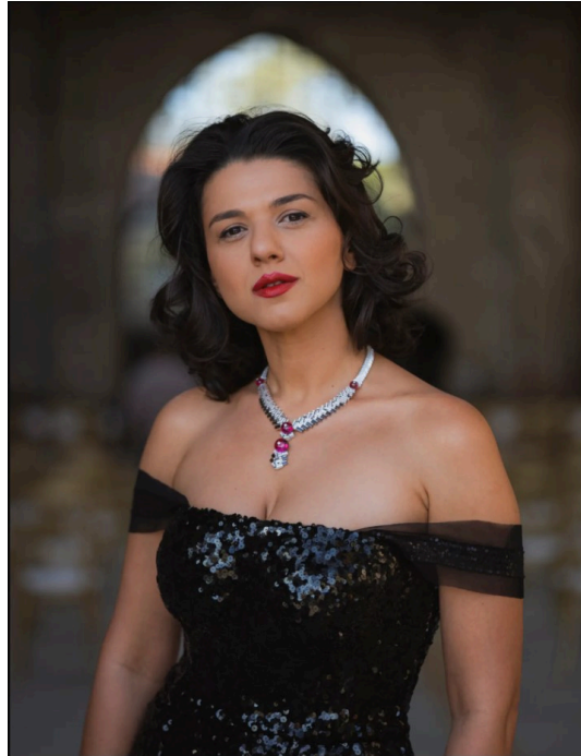
Khatia Buniatishvili