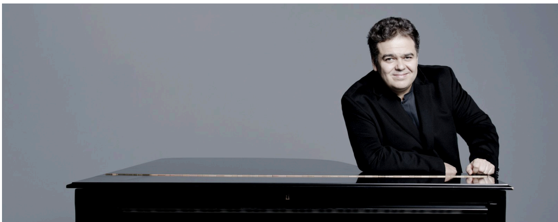
Arcadi Volodos