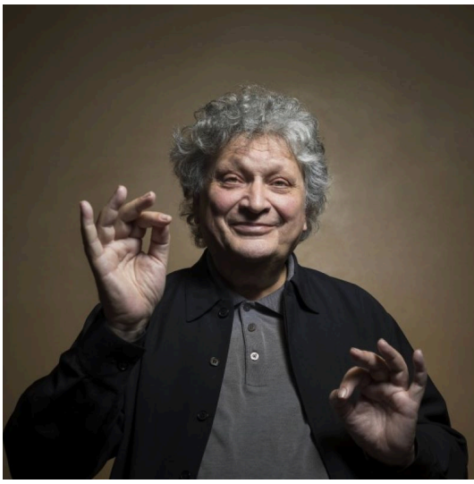
René Jacobs