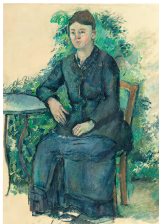
Paul Cézanne, Madame Cézanne au jardin (détail), vers 1880, ht, 80 x 63 cm, Musée de l'Orangerie

Au Foyer de la Fondation LÉONARD GIANADDA SUR LES TRACES DE TINTIN Dialogue d'images autour du monde