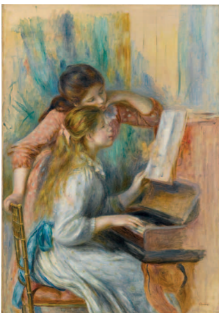
Auguste Renoir, Jeunes filles au piano , vers 1892, ht, 116 x 81 cm, Musée de l'Orangerie

Chefs-d'œuvre des collections des Musées de l'Orangerie et d'Orsay, Paris