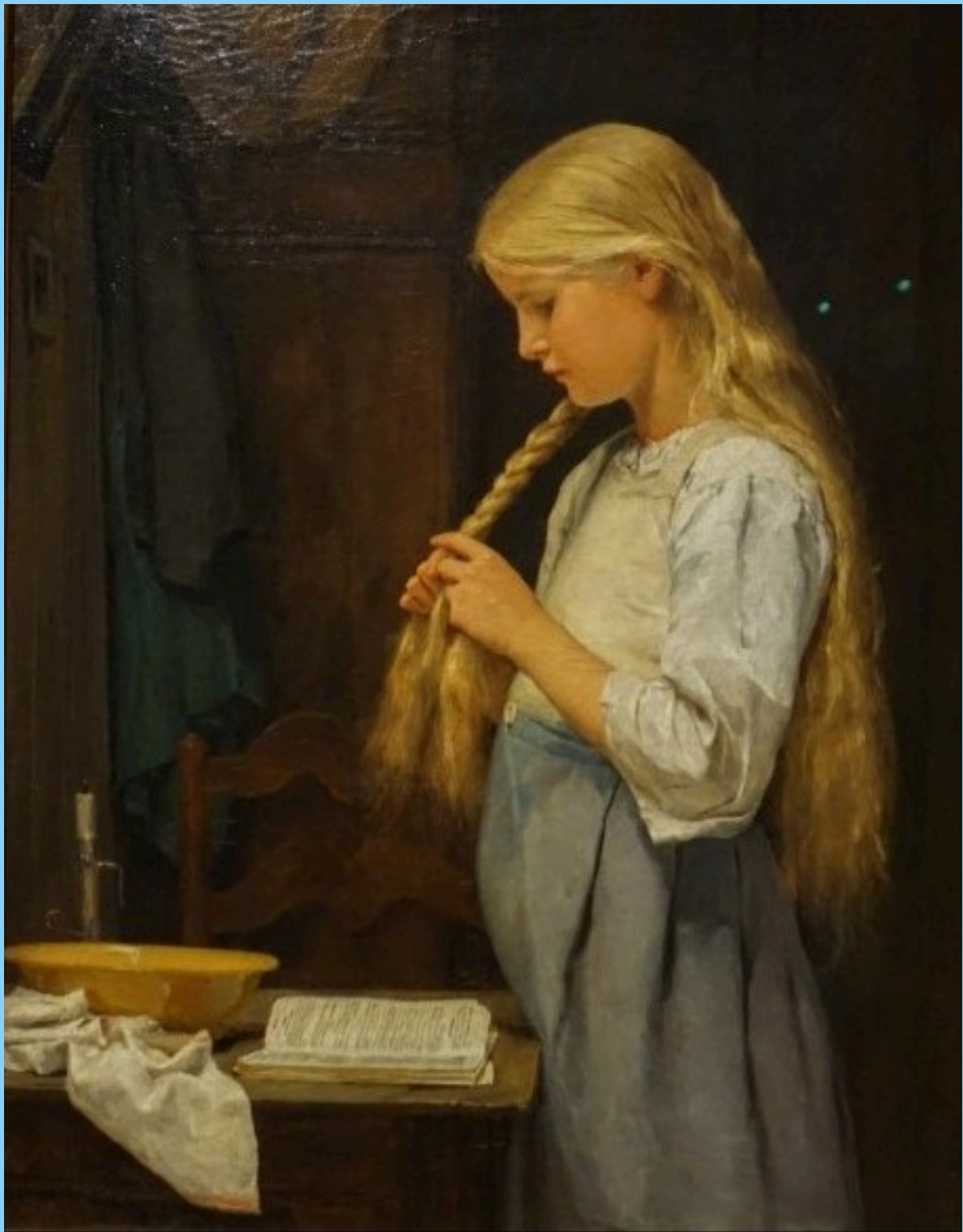
Jeune fille se coiffant, 1887 Huile sur toile 70.5 x 54 cm Stiftung für Kunt, Kultur und Geschichte, Winterthur