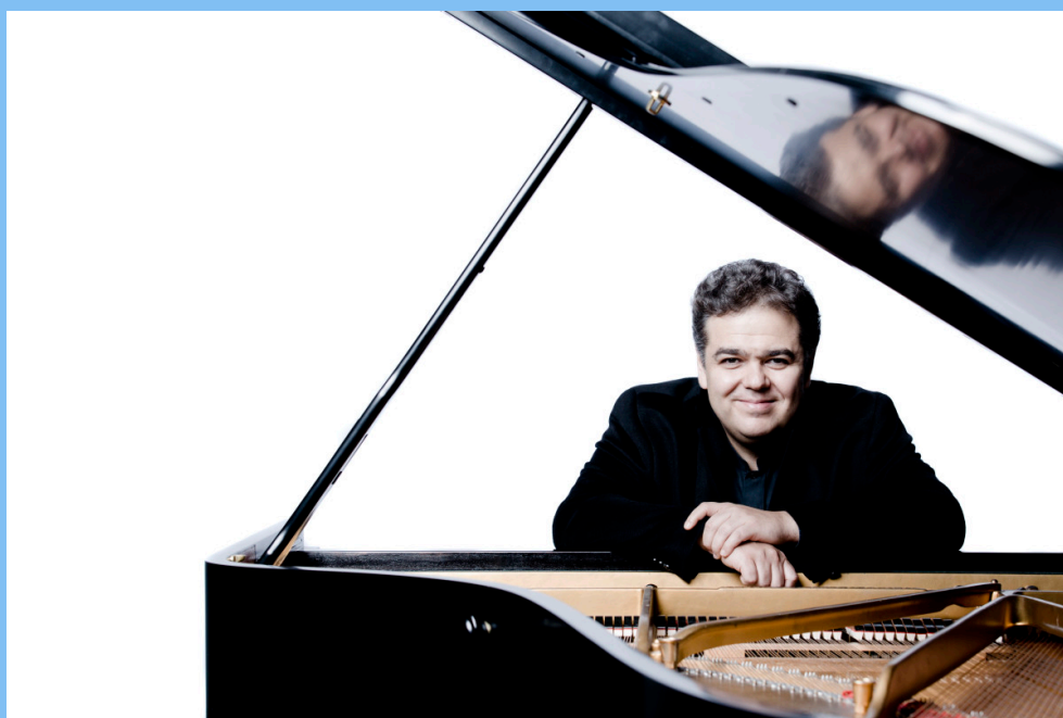
Arcadi Volodos

« Ce n'est plus du piano, c'est de la musique à l'état pur » (LE TEMPS – 10/11/2019 - SYLVIE BONIER).