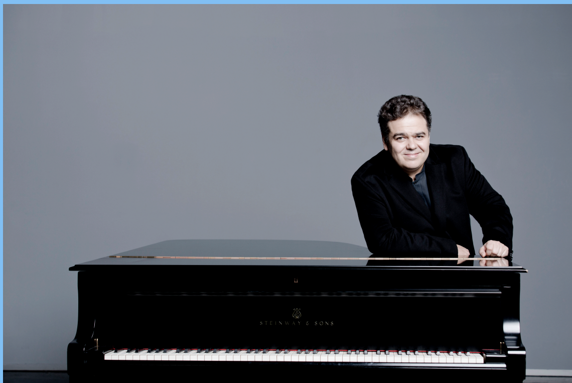
Arcadi Volodos