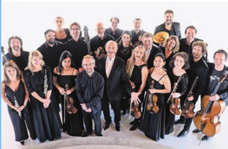
CHAARTS Chamber Artists