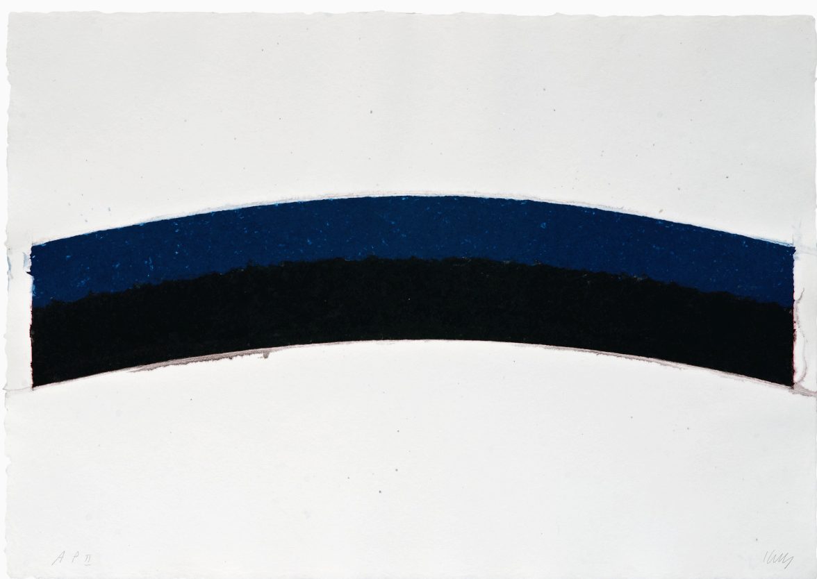
Ellsworth Kelly (1923-2015), Image en papier coloré III (Courbes bleu noire), 1976, pulpe de papier coloré et pressé, épreuve d'artiste no IV, 82,6 × 118,1 cm (feuille), Paris, Institut national d'histoire de l'art