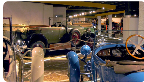
Musée de l'automobile