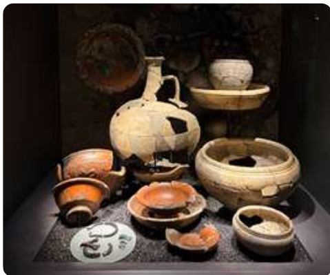
Musée Gallo Romain

Tombe à incinération n°63 du type "à ossements dispersés" largement représenté dans la nécropole de l'amphithéâtre. Dans une grande fosse d'env. 1,05 x 0,5m, les ossements d'un adulte sont mélangés aux