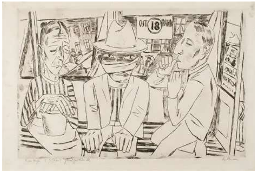
Max Beckmann (1884 - 1950), Dans le tram (In der Trambahn), 1922, Pointe sèche sur papier japon, tirage 17/20, R. Piper & Co. (éditeur), 49,3 x 53,6 cm (feuille), 29 x 43,5 cm (coup de planche)